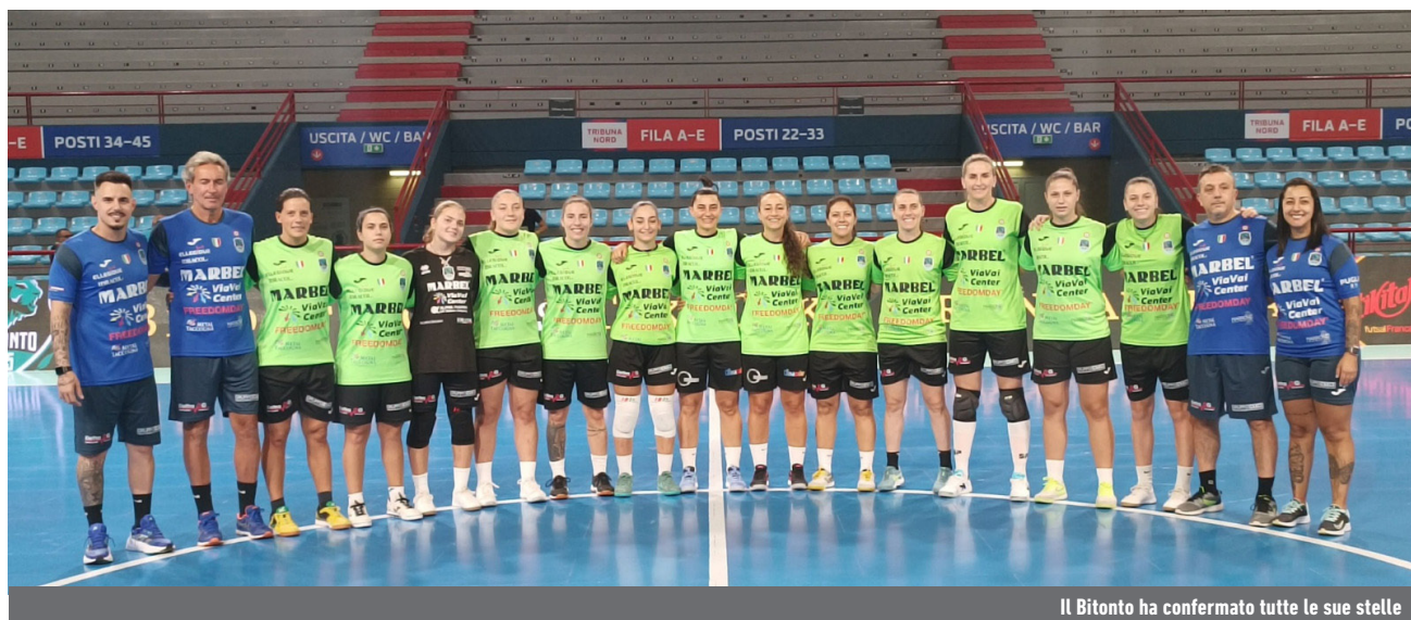
Il Bitonto ha confermato tutte le sue stelle