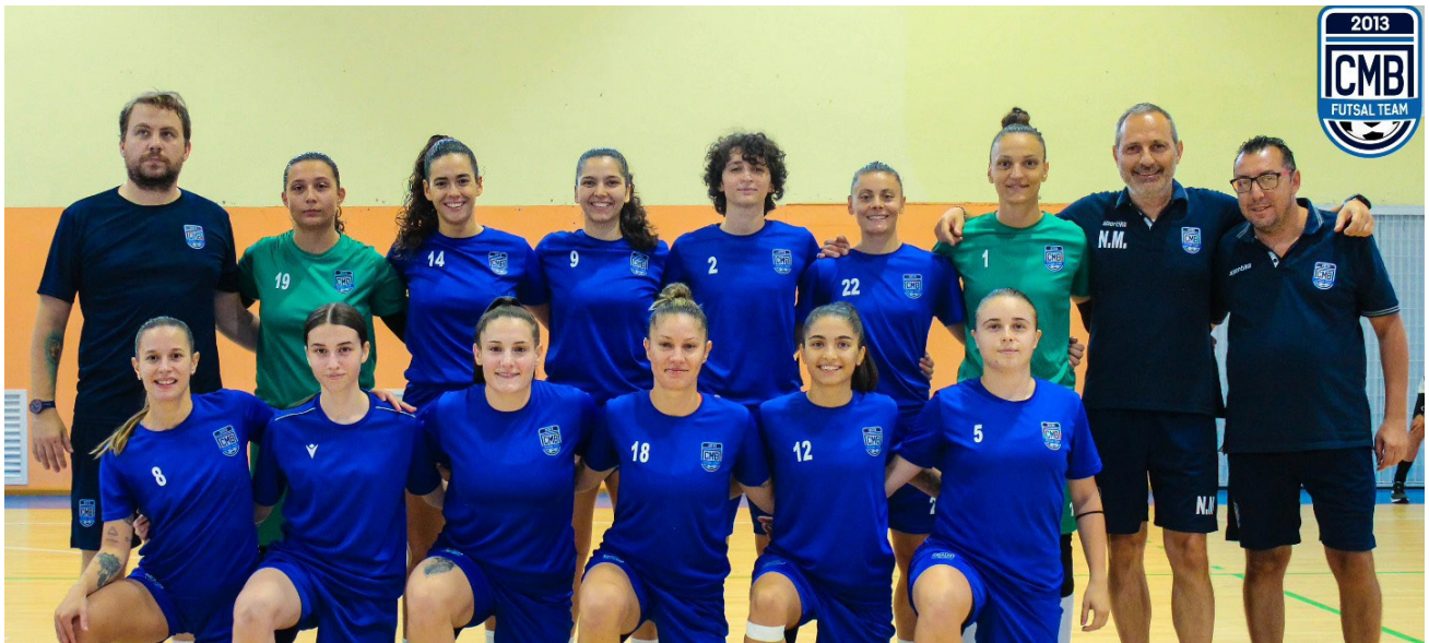
La matricola CMB farà il suo esordio con la Kick Off