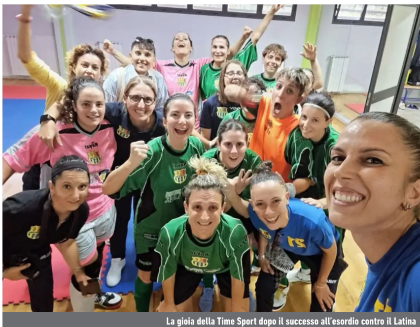
La gioia della Time Sport dopo il successo all'esordio contro il Latina