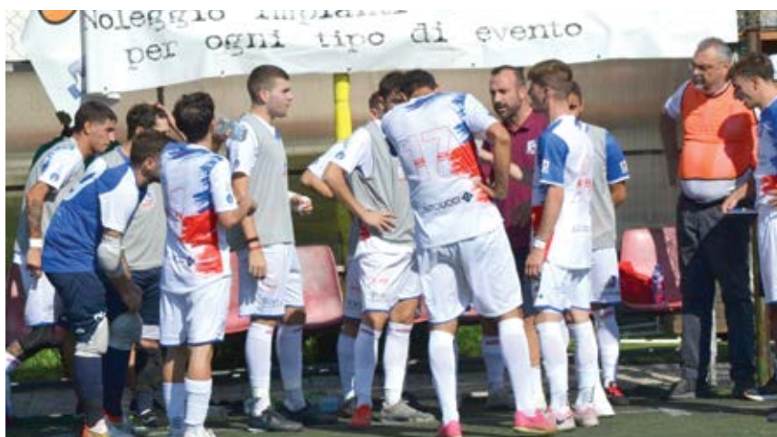
L'Ardea ha iniziato la stagione con una vittoria di misura contro il Città di Colferro

Girone B - Nel gruppo B, solamente il Parioli, reduce da un ottimo 4-2 sul campo de La Pisana,