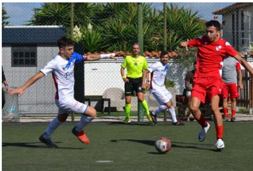
Una fase di gioco di Laundromat Gaeta-Ardea

Girone B - Dall'altra parte, dunque, è il roster guidato da Claudio Ricci a occupare il trono: il Santa Gemma, sabato 28 settembre, ha espugnato 4-3 il quartier generale del Cecchina.