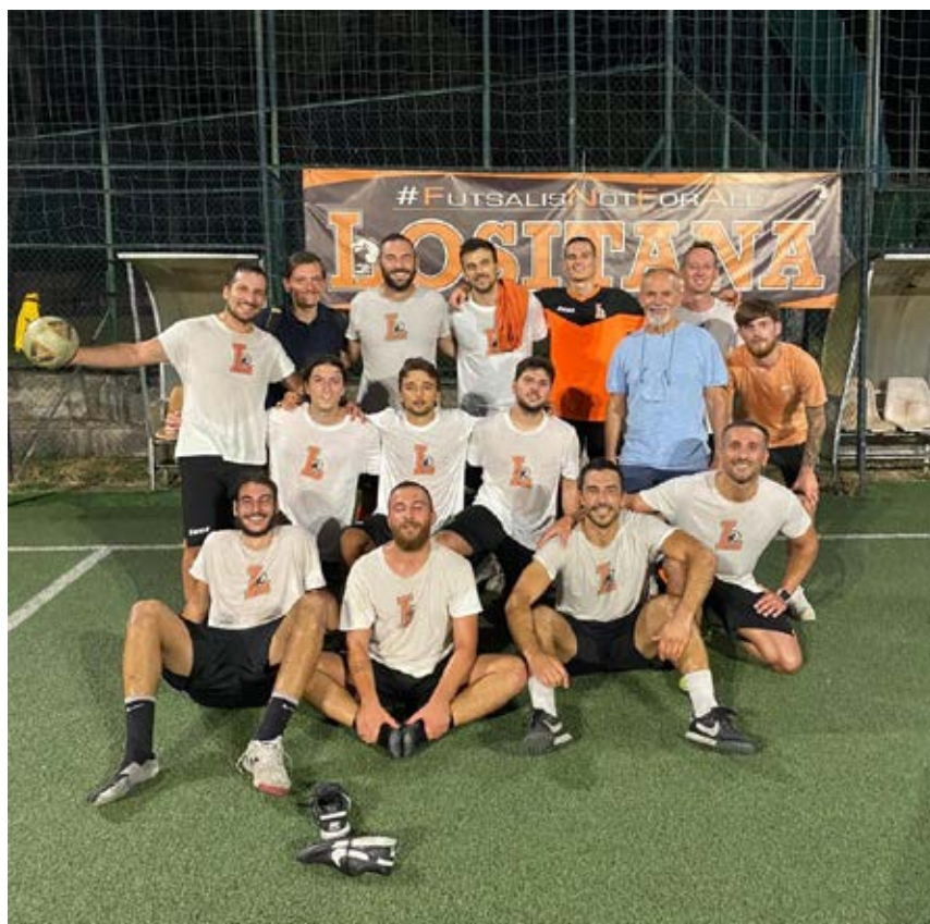
La Lositana affronterà i Forty Fighters nella prima giornata

contro l'Atletico Velletri. Lo start del girone D metterà di fronte le matricole CX Roma e Don Bosco Cinettä, entrambe desiderose di vivere una stagione da protagonisti anche in C2. Le due neopromosse dovranno sicuramente fare i conti col San Luca, che - in trasferta - affronterà la matricola Virtus Lazio.