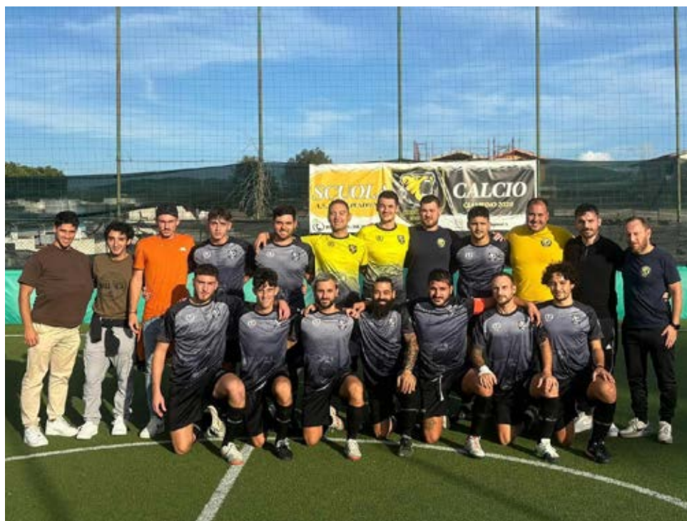
L'Indipendente Ciampino guida il girone A a pari merito con l'Eagles Frosinone