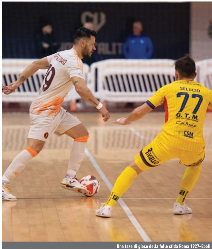
Una fase di gioco della folle sfida Roma 1927-Eboli

Supercoppa, imperdibile Feldi Eboli-L84. Last but not least Vitulano Drugstore Manfredonia-Active Network, un match focale in ottica salvezza.