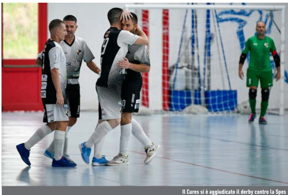
Il Cures si è aggiudicato il derby contro la Spes

Girone F - Il Formia si impone sul Casagiove e sale a quota 26, a +5 sul San Marzano, che piega 9-1 un Parthenope scivolato fuori dalla zona playoff in favore del Sinope. Quest'ultimo, a segno sul Ciampino, affianca (a quota 18) il Potenza, k.o. con una Virtus Libera che resta a -6 dalla vetta. Al Senise lo scontro salvezza col Real Castel Fontana: lucani a 5, castellani ultimi a 3.