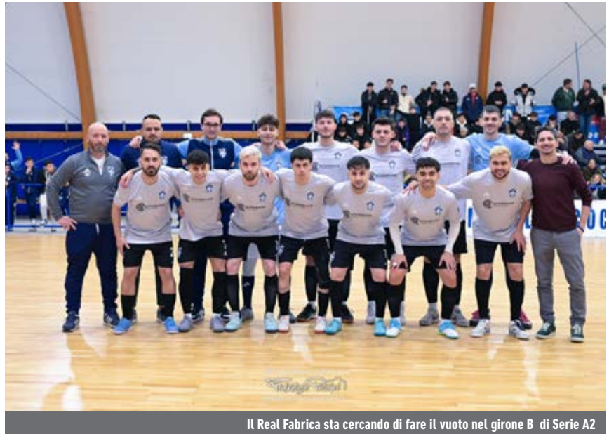
Il Real Fabrica sta cercando di fare il vuoto nel girone B di Serie A2

A2 - Grazie al poker rifilato all'Altovicentino, l'OR guadagna una punto sul secondo posto: +4 sul Cornedo, che espugna Belluno e si porta a +1