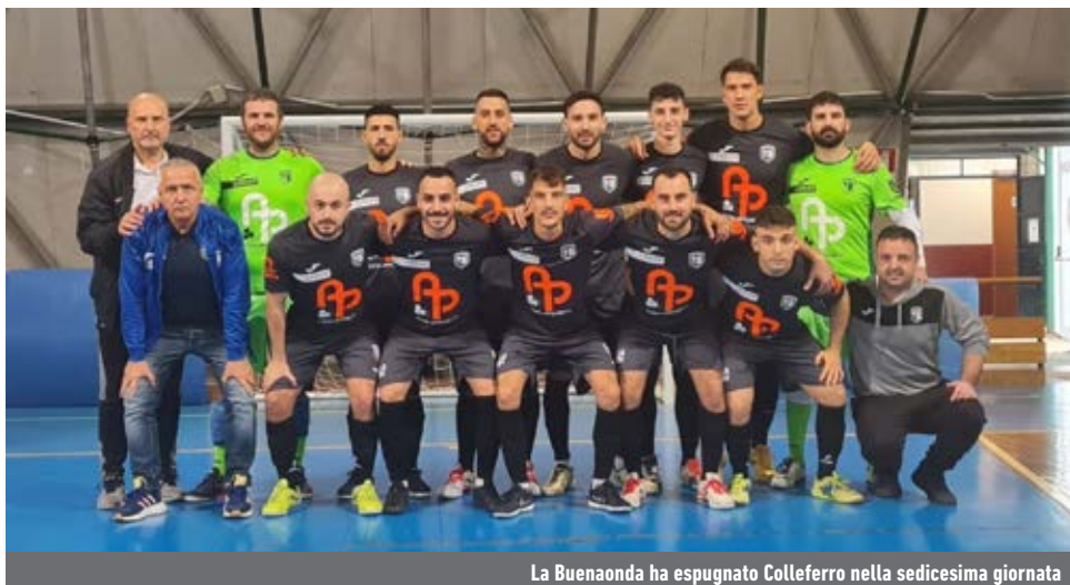
La Buenaonda ha espugnato Colferro nella sedicesima giornata

la dimora del Parma Letale, ha ora cinque punti di ritardo dalle "tigri". La Pisana, nell'imminente weekend, sarà chiamata a rispondere ai rivali in occasione del match casalingo contro il Santos, reduce dal kappà patito col PGS Santa Gemma.