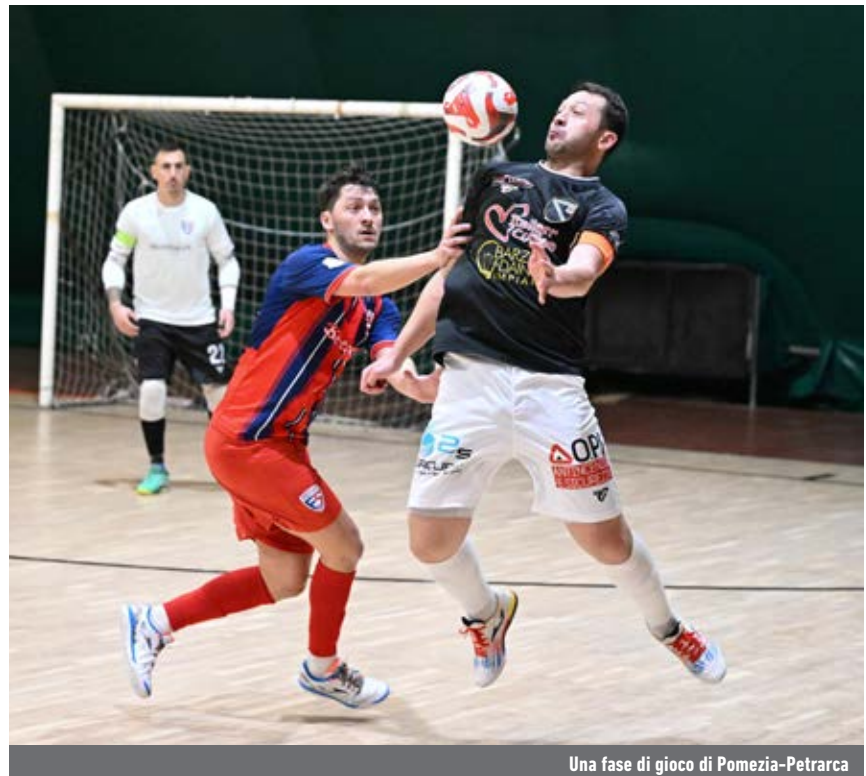
Una fase di gioco di Pomezia-Petrarca