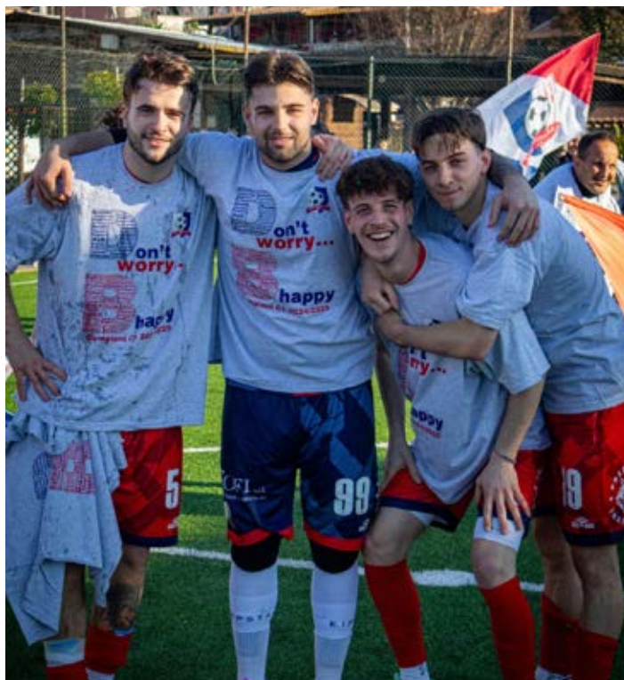
L'Ardea festeggia la promozione nel nazionale

Girone B - Il ventiduesimo round ha sorriso a La Pisana: il battistrada del girone B, autore di un tris esterno ai danni della Futsal Academy, ha riallungato a +5 sulla Pro Cecchina, caduta 2-0 al cospetto del Bracelli Club. Le "tigri" di Mirko Beccaccioli, rispetto ai castellani, hanno disputato un match in meno, che verrà recuperato - contro la Vigor Perconti - martedì 11 marzo. Sul gradino più basso del podio c'è ora l'Editaly Lidense, che ha scavalcato il main roster di Civitavecchia grazie alla cinquana inflitta al Santos.