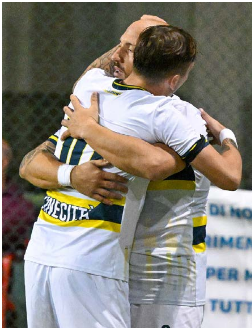
Il Don Bosco Cinecittà è la nuova capolista del girone D

archiviato 8-5 la pratica Edilisa Marino, si sono portati a +4 sulla Ludis Italica - scivolata 5-3 al cospetto del Campus Aprilia -, la principale inseguitrice per quel che concerne la rincorsa alla postseason.