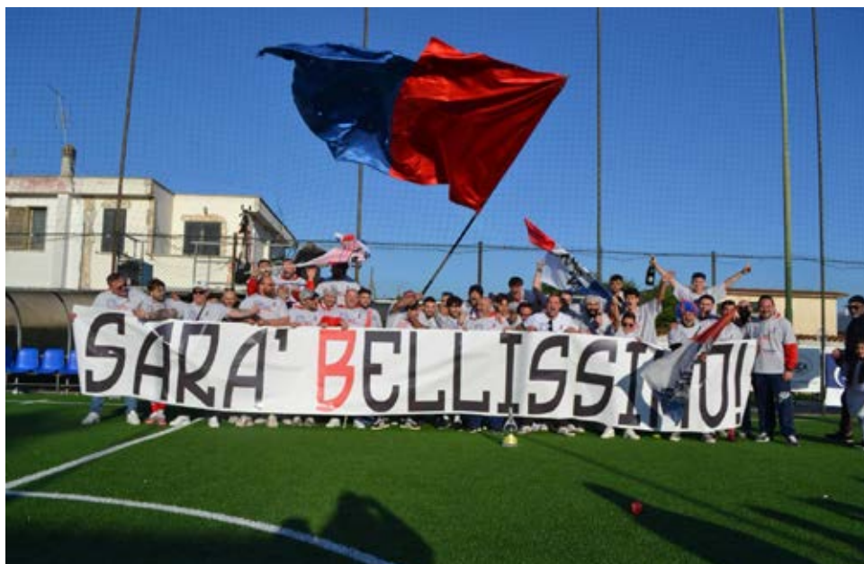
Il prossimo anno l'Ardea sarà protagonista in Serie B