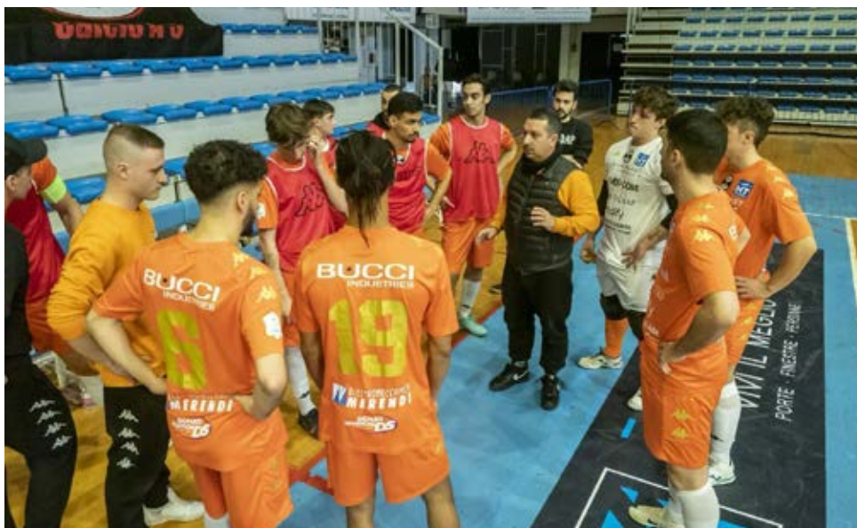
Un time out del Mernap Faenza, leader del girone D

Girone F - Il Formia cade tra le mura amiche col Sinope e dà la chance al San Marzano - ok sul Casagiove - di portarsi a -2 con una gara in meno. In coda successi fondamentali del Real Castel Fontana sul Potenza e del Real Ciampino sul Senise, ultimo e sempre più lontano dalla permanenza in B.