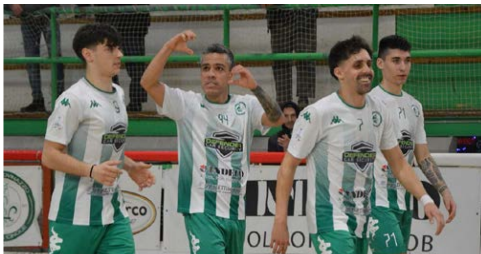
Il Giovinezza ha sconfitto la capolista Capurso sia all'andata che al ritorno

A2 Elite - Ai vertici del Girone A cambia poco. MestreFenice e Mantova vanno a segno in entrambe le giornate, mantenendo inalterato il gap di due punti in favore dei lagunari. Al terzo posto spicca ora il Rovereto, salito sul podio nel weekend e confermato grazie al 4-3 al Verona. Nel gruppo B si registra il terzo stop del Capurso, con la caduta infrasettimanale contro