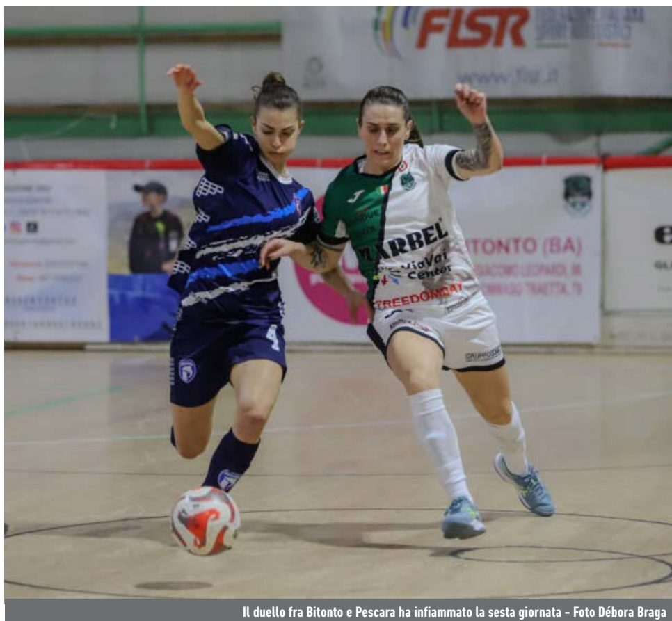
Il duello fra Bitonto e Pescara ha infiammato la sesta giornata