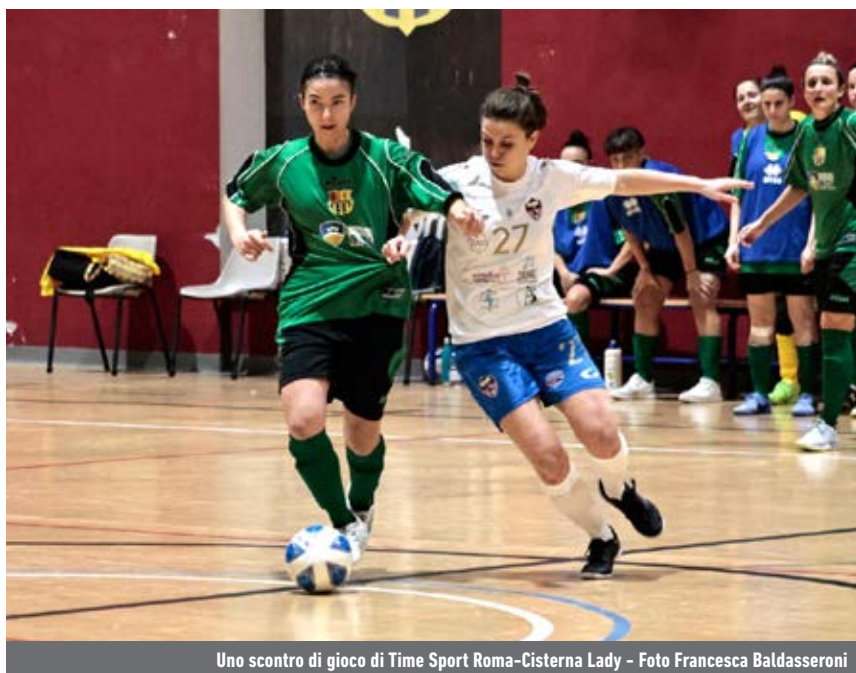
Uno scontro di gioco di Time Sport Roma-Cisterna Lady

Le altre - Il blitz sul campo della Time Sport ha consentito al Cisterna Lady di agganciare al quarto posto proprio la formazione di Luigi Guidi, sconfitta 2-0 nel suo PalaTorrino, e, al contempo, di scavalcare il Progetto Futsal. Il team di David Calabria, al 3Z, ha pareggiato 5-5 con