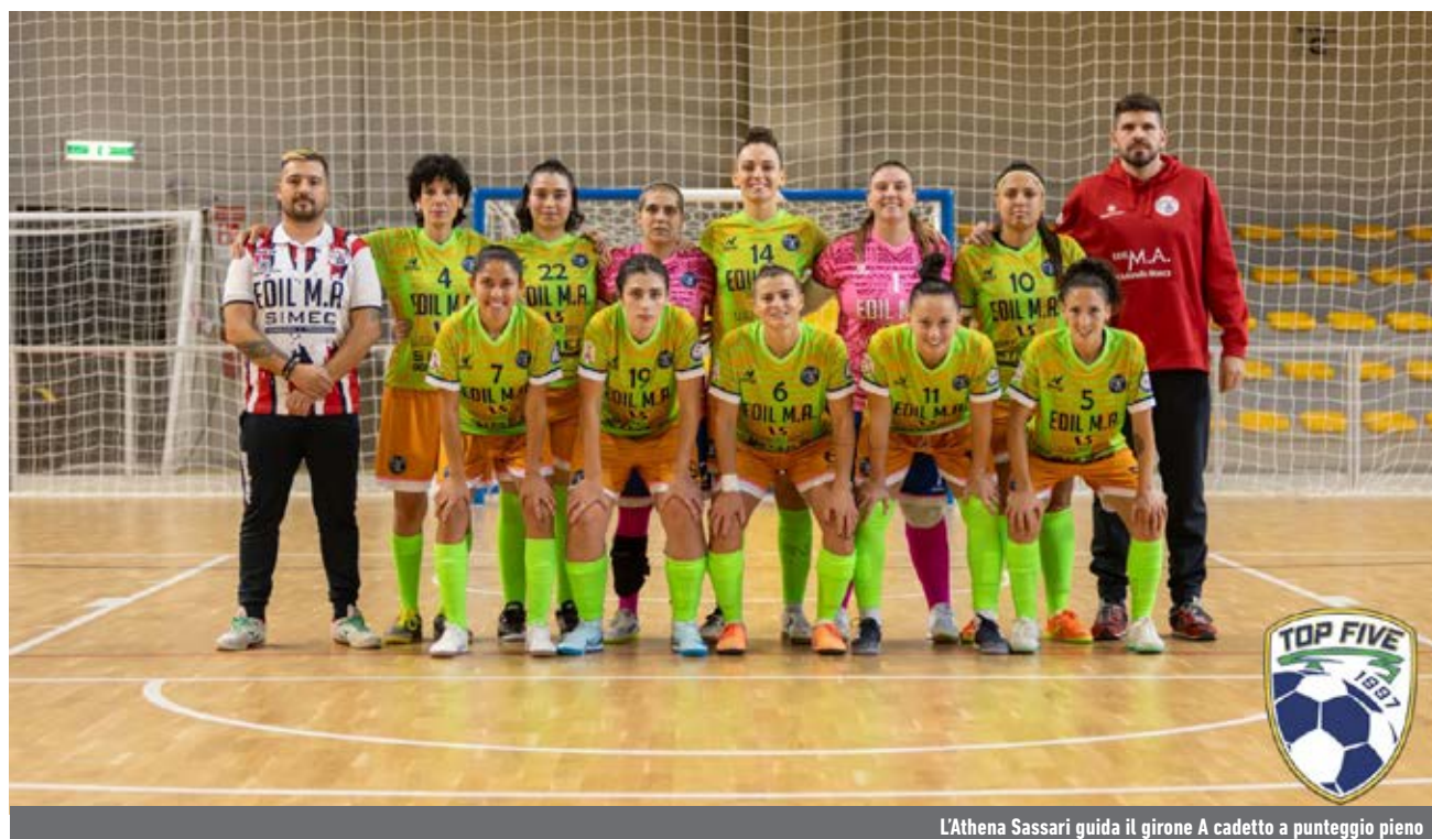
L'Athena Sassari guida il girone A cadetto a punteggio pieno