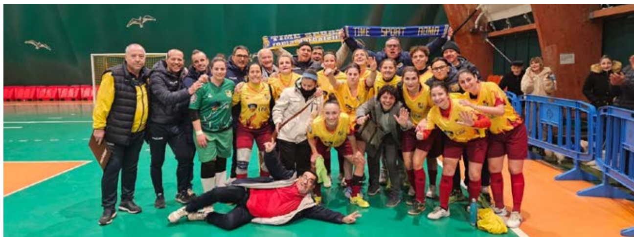
La Time Sport esulta dopo aver sbancato il PalaLevante

pokerissimo casalingo contro l'Atletico San Lorenzo (5-1). Il 3-2 interno ai danni del Pontinia ha permesso al Latina Sport Academy di tenersi a distanza di sicurezza dalla zona rovente della classifica, lontana sette punti. L'altro scontro per la permanenza nel regionale, ossia Olympus Tiburtina Valley-Brasil, si è risolto senza vincitrici né vinte (3-3). Il futsal laziale in rosa osserverà ora un weekend di relax: per il penultimo round dell'andata bisognerà attendere il 6 dicembre.