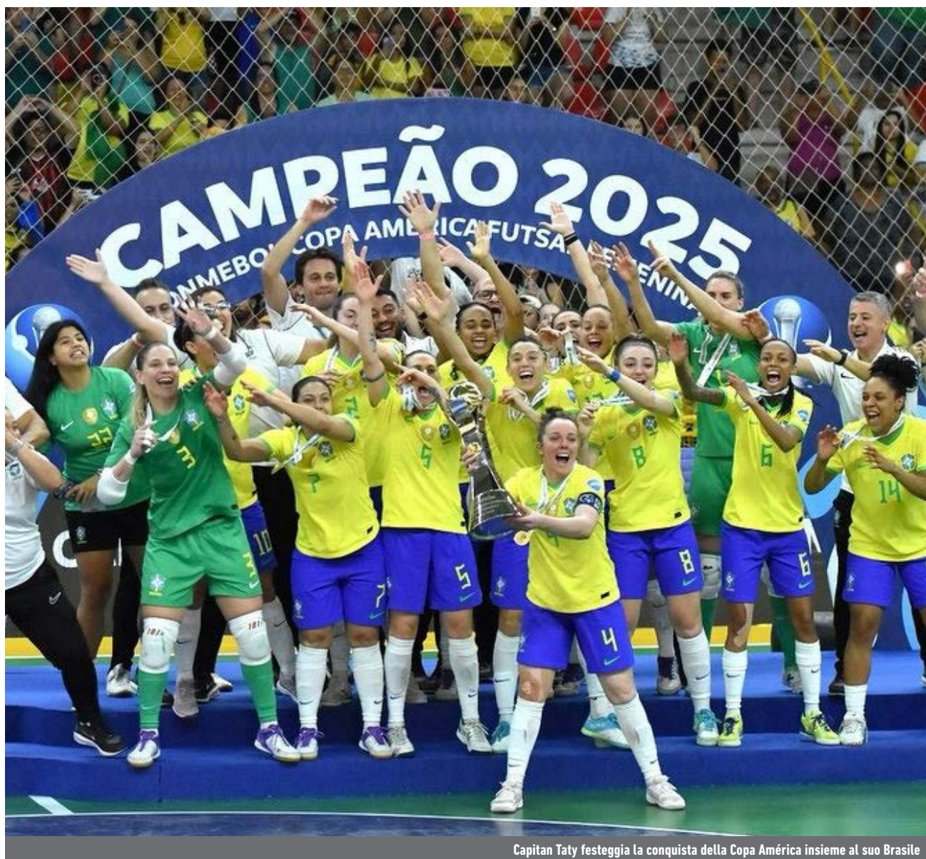
Capitan Taty festeggia la conquista della Copa América insieme al suo Brasile

Fab8 - Il day one della kermesse pugliese, in programma il 3 aprile, coincide con i quarti della categoria regina. Il Bitonto, che si è portato a casa le ultime due coccarde, è la squadra da battere, soprattutto ora che sono tornate dal Sud-America le sue quattro stelle. A fare subito i conti con le leonesse ci sarà l'Audace Verona, che proverà a compensare l'assenza dell'infortunata Ferreira con l'entusiasmo scaturito dalla prima partecipazione alle Finals di Coppa Italia. Nello stesso lato del tabellone c'è il match di gran lunga