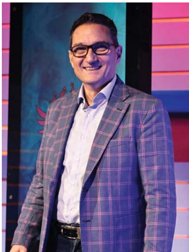
Il presidente Paolo Anedda

Delusione - Osservando l'andamento della stagione, si può notare come il cammino delle gialloblù sia stato troppo altalenante per poter competere realmente contro le big delle campionati, come confermano i 20 punti di stacco dalla prima della classe. Eppure, ai nastri di partenza le attese erano elevate: "Inutile negarlo, ci aspettavamo ben altro piazzamento, ma gli imprevisti sono stati tanti e non siamo