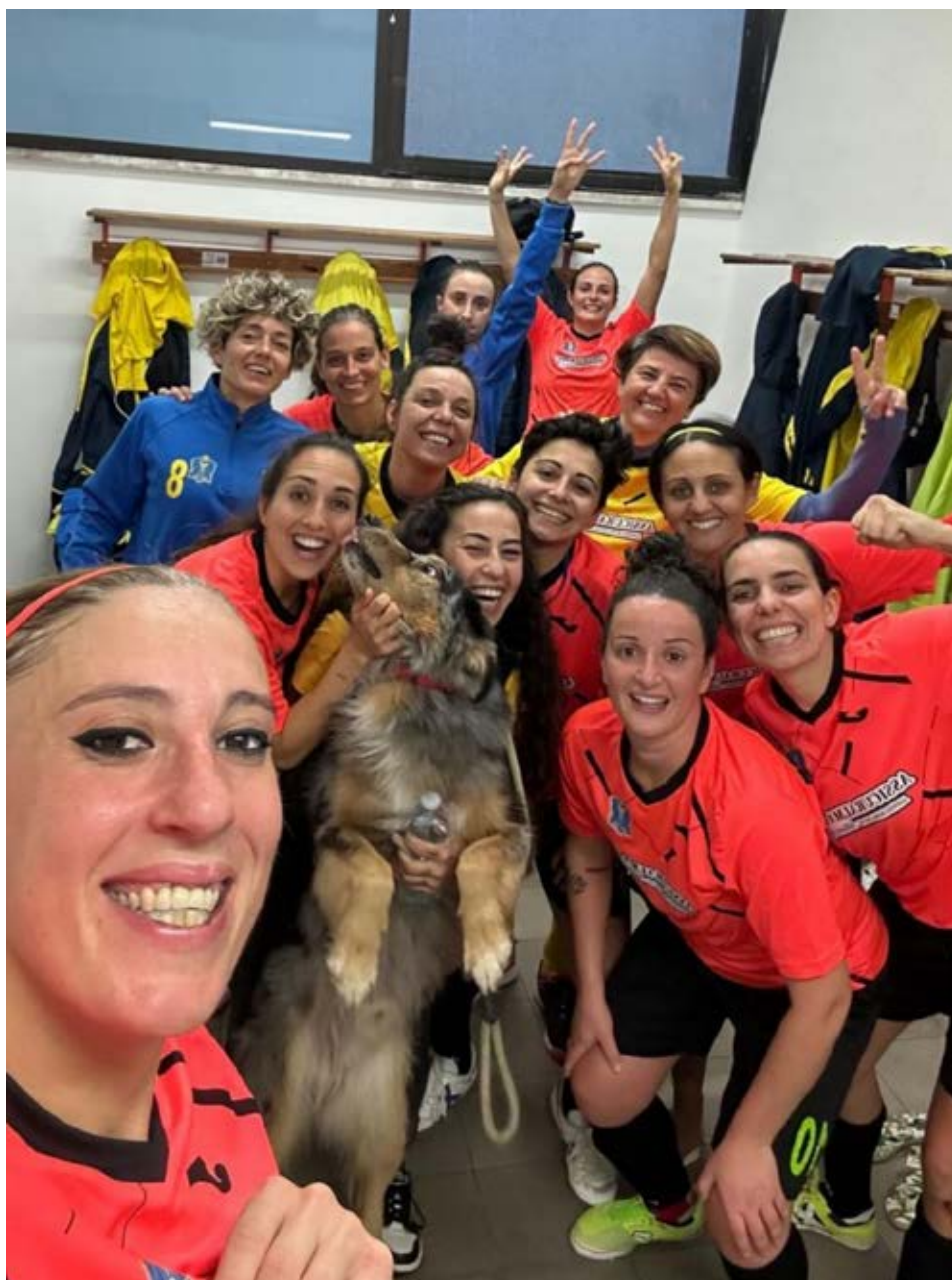
La Coppa d'Oro rappresenterà il Lazio nei playoff nazionali

Olimpus Tiburtina Valley-Sporting Fondi 5-1