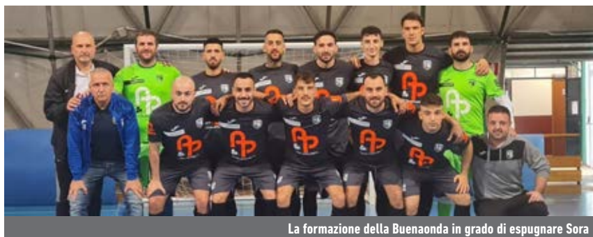
La formazione della Buenaonda in grado di espugnare Sora

La sosta - Il penultimo round della regular season d'andata avrà luogo sabato 7 dicembre. Il 30 novembre, però, scenderanno in campo sei compagini del girone A, tutte impegnate nei recuperi. Il Latina, al PalaPark, si giocherà la sua chance di salire sul gradino intermedio del podio contro la Laundromat Gaeta. Il duello fra Sporting Terracina e Città di Zagarolo, invece, metterà in palio preziosi punti per la permanenza in C1. Anche il Sora, una delle tre compagini sul fondo della classifica, andrà a caccia di bottino in ottica salvezza, ma, tra le mura amiche, sarà chiamato all'impresa contro un Gap ormai stabile nelle zone nobili della classifica.