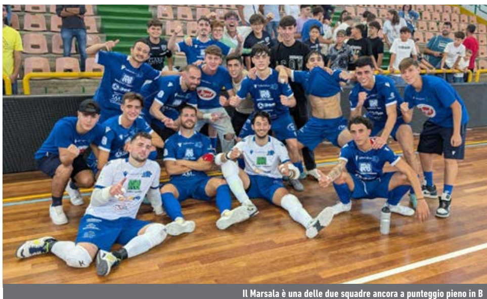
Il Marsala è una delle due squadre ancora a punteggio pieno in B

Girone F - Nonostante l'interruzione per motivi di ordine pubblico della sfida col Parthenope, il Formia si tiene la vetta del gruppo con 14 punti. Ne approfitta solo la Virtus Libera, che sbanca Senise e si porta a -1 con lo stesso numero di gare disputate. Primo acuto del Real Ciampino nello scontro salvezza col Casagiove. Ancora k.o. il Real Castel Fontana, piegato in casa dal Sinope.