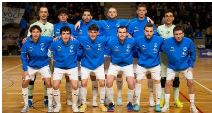
Lo Sporting Altamarca continua a volare nel girone A di Serie A2 Élite

(15) vanno in doppia cifra e restano in scia con una gara in meno dei toscani. Il Sulmona sbanca il campo del fanalino 3Z e si riprende la testa del gruppo C in luogo dell'Italpol, fermo ai box. Abruzzesi primi a 16, romani a -1 insieme al Domitia, all'inglese sulla Cioli. Conit quarto a quota 14. Nel D regna l'equilibrio. Il Soverato frena in casa e si fa riprendere a quota 14 dall'Audace Monopoli; a -1 inseguono il Bitonto, reduce da una 'x' in esterna, e il Canicatti, steso dal Canosa. Sammichele quinto a -2 dalla vetta.