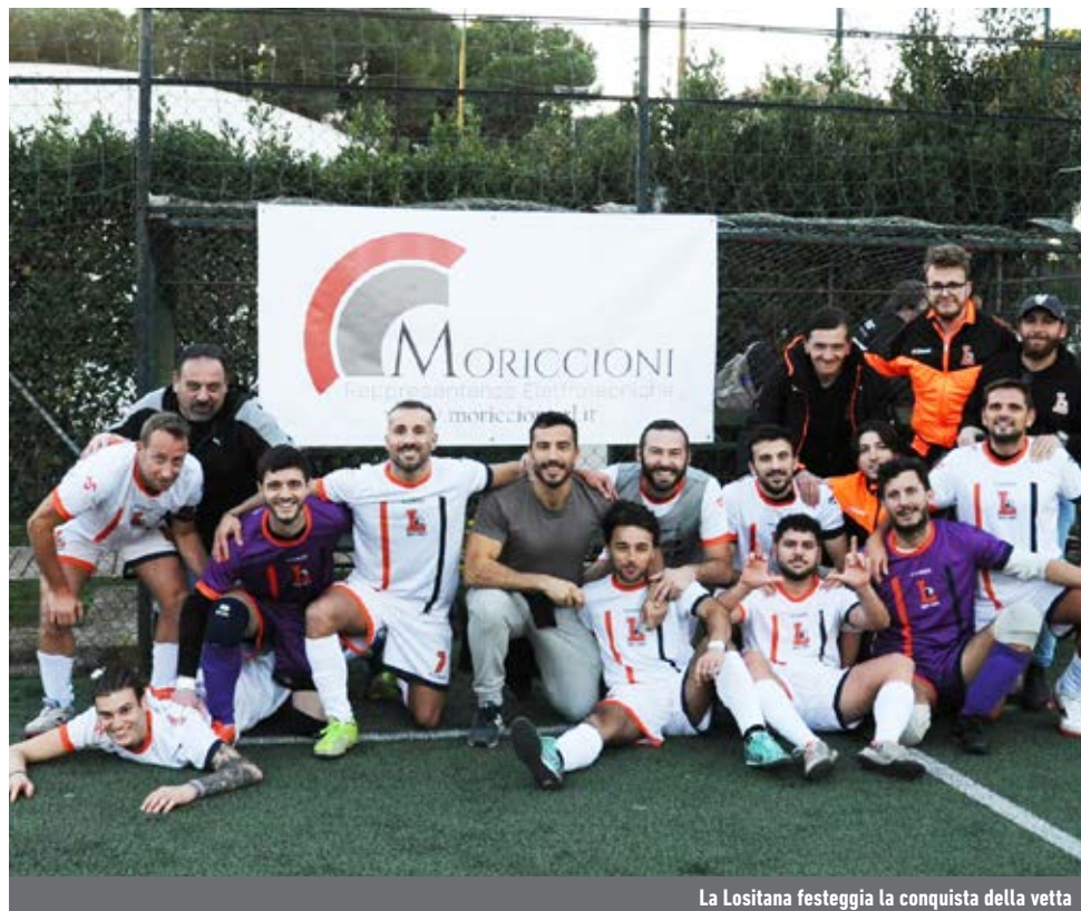
La Lositana festeggia la conquista della vetta

La sosta - Il decimo turno verrà disputato fra venerdì 6 e sabato 7 dicembre. Il 30 novembre, invece, verranno giocati un anticipo, valevole per l'undicesima giornata del girone A, e un recupero, riguardante il gruppo B. Il battistrada ciociaro, tra le mura amiche, sarà alle prese col complicato duello contro l'Insieme Formia, la terza miglior difesa (15 reti incassate). Una vittoria dell'Anguillara, ospite del fanalino di coda Ronciglione, permetterebbe ai virtuosini di portarsi a -1 dalla zona playoff.