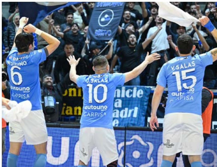
Nella bolgia del PalaJacuzzi, il Napoli ha inflitto il primo stop all'Ecocity

Il primo acuto - Nella settima giornata di Serie A si è sentito il primo acuto dell'Italservice Pesaro, corsara a Treviso contro un Came che non perdeva dalla prima di campionato, a Catania contro la Meta. Già, i campioni d'Italia sono volati in Spagna a casa del favorito Cartagena per godersi l'Elite Round di Champions League senza pressioni: comunque vada, sarà un successone.