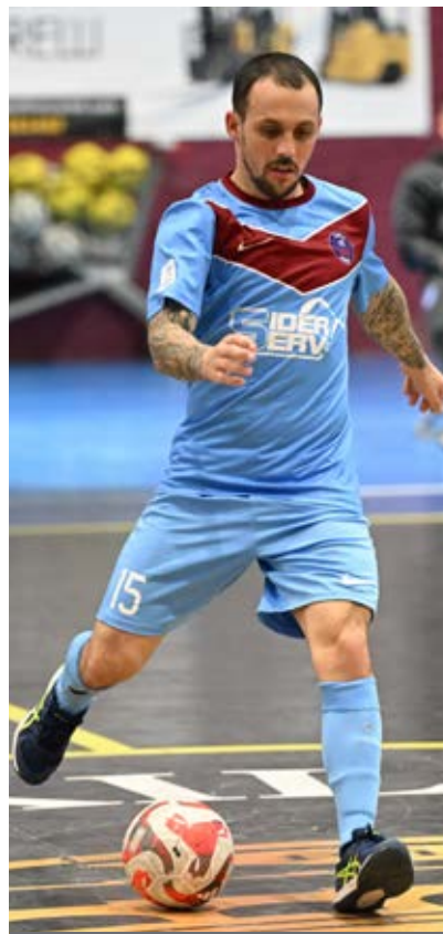
Papù è ancora a caccia della prima rete stagionale

avuto una costanza, ma ho altre caratteristiche, non penso di essere un vero bomber".