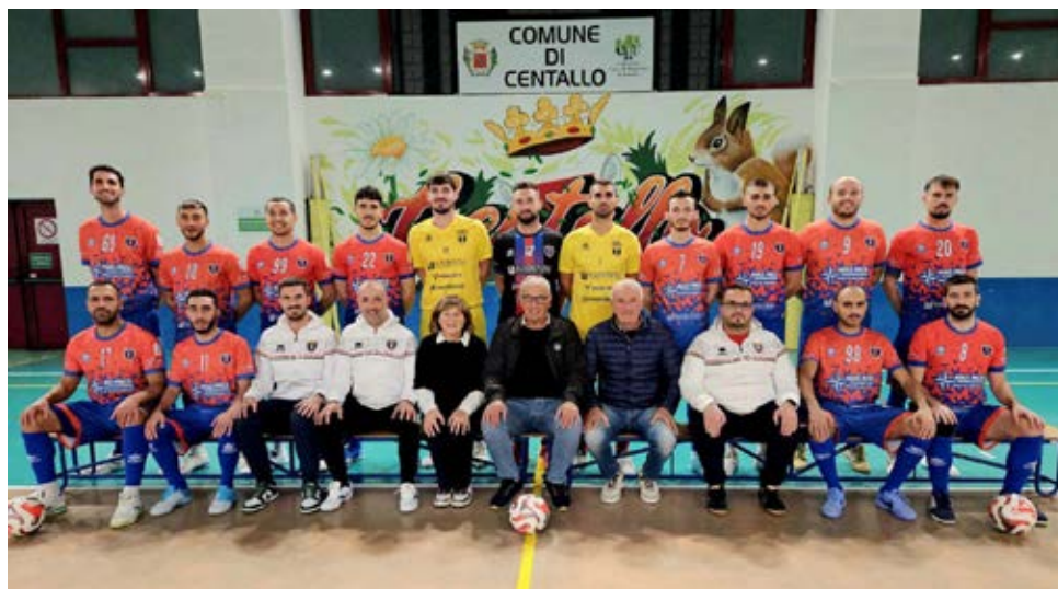
Il Centallo ha riaperto il discorso primo posto nel girone A

Verso il traguardo - Il testa a testa del Girone A è sempre più aperto: il Centallo si prende lo scontro diretto e accorcia a -2 dal Real Sesto, che, però, ha una gara in meno. La Jasnagora supera il Varese e resta a due lunghezze dal secondo posto. Il Villorba frena sul campo del Team Giorgione e il Futsal Giorgione, ok sul Padova, va a -2. Bissuola ai box e a -6 dalla vetta del Girone B. Nel C, invece, la X Martiri va in doppia