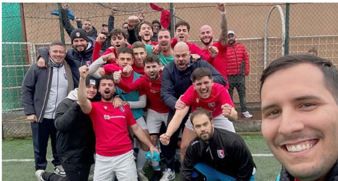
Il selfie post vittoria del San Giustino, a segno sulla Lositana