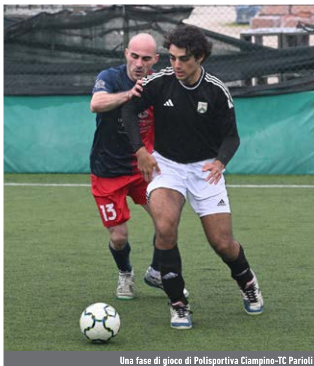
Una fase di gioco di Polisportiva Ciampino-TC Parioli

Girone A - Chi è già salita in cadetteria è l'imbattuta Ardea, che, non sazia dell'importante traguardo raggiunto nella passata settimana, ha espugnato 5-3 il PalaPark, quartier generale del Latina. La Buenaonda, però, non ha approfittato del passo falso dei nerazzurri per mettere in cassaforte la seconda piazza del girone A: gli aranceri, infatti, sono scivolati