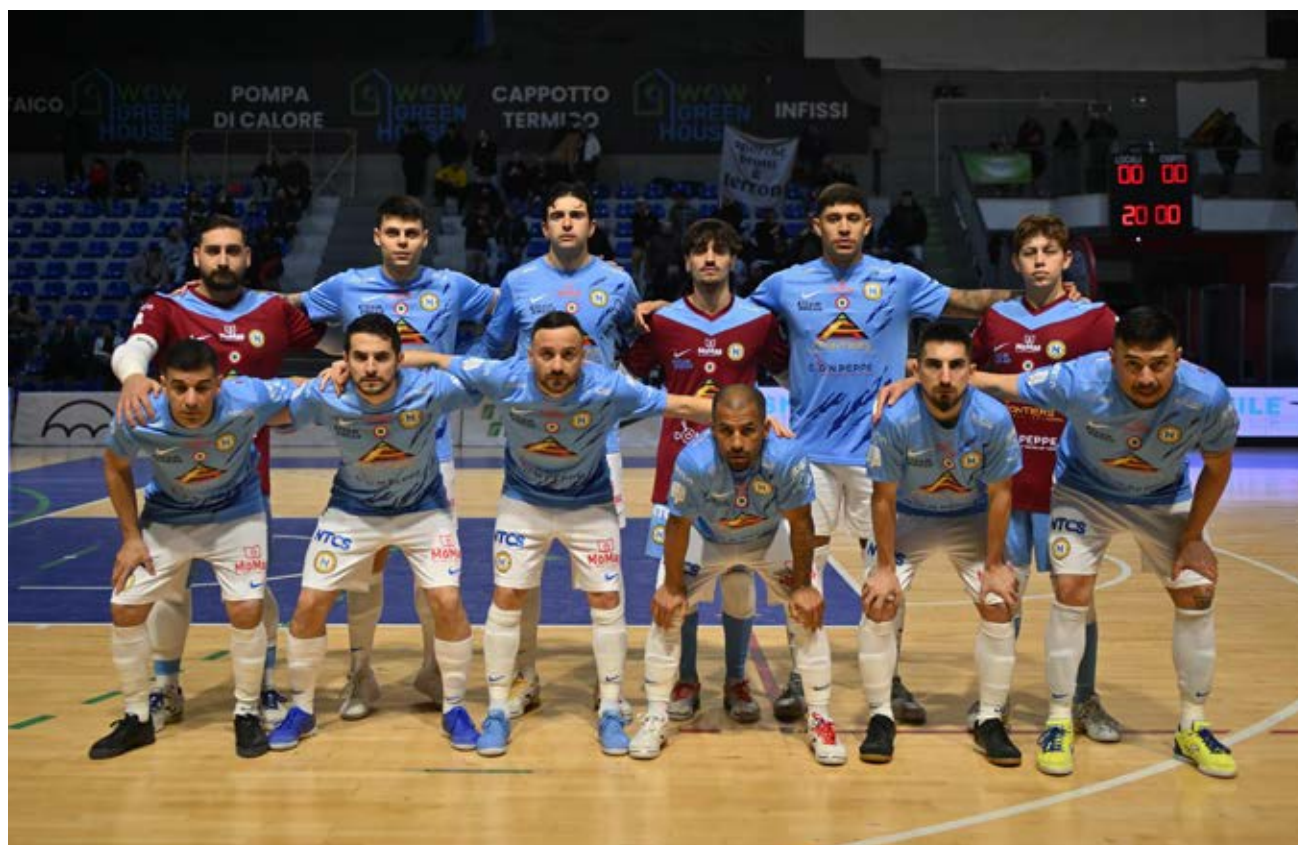
La formazione del Napoli che ha affrontato la Fortitudo Pomezia