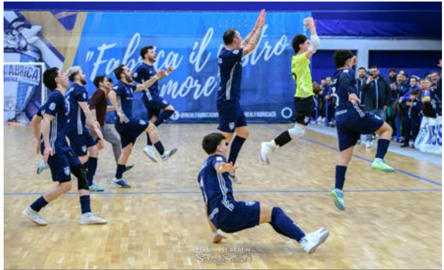
La gioia del Real Fabrica, l'unica capolista di A2 a segno nell'ultimo weekend

Grifoni, che si avvicina ai playoff. La cinquina interna al 3Z permette al Sulmona di tenere viva la corsa al titolo nel Girone C: abruzzesi a -4 dall'Italpol, rimasto ai box. Colpo playoff per l'Eur: batte l'Anzio e va a +6 sul Frosinone. Gerarchie mutate nel gruppo D: il Bitonto si fa doppiare dalla Gear Siaz e il Soverato, a segno con un poker sul Castellana, lo agguanta in vetta. Occhio al Canicatti: stende il Canosa e va a -2 dalla coppia di vertice.